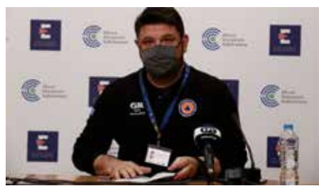
Άρα στο επίπεδο πολύ αυξημένου κινδύνου (βαθύ κόκκινο) βρίσκονται πλέον:

Στο επίπεδο πολύ αυξημένου κινδύνου παραμένουν επίσης οι Περιφερειακές Ενότητες Αχαΐας και Εύβοιας (πλην Σκύρου), ο Δήμος Μυκόνου, καθώς και η Περιφέρεια Αττικής, όπου όπως έχει ήδη ανακοινωθεί τα μέτρα που έχουν ληφθεί ισχύουν μέχρι τις 28 Φεβρουαρίου.